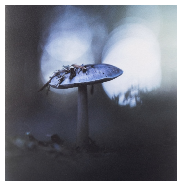
RAL & Motiv Druck