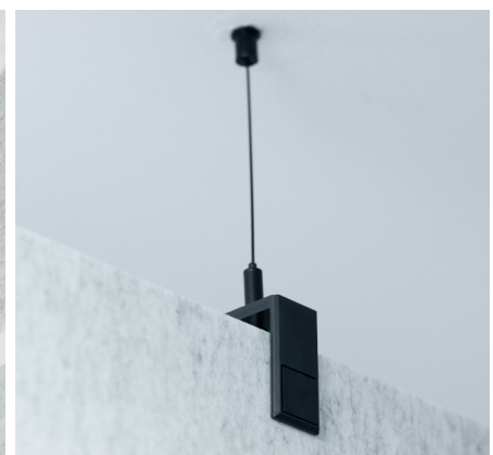
Komfort Seilabhngung, schwarz