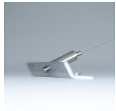
Komfort Abhängung für Circle