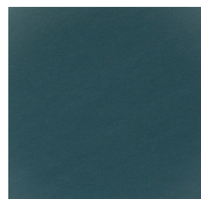
RAL Oberflächen Druck