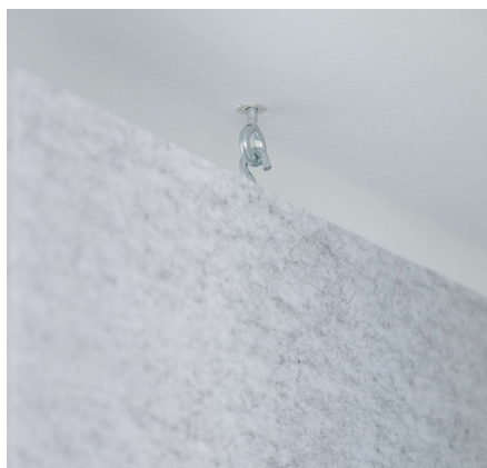
Öse & Schraube